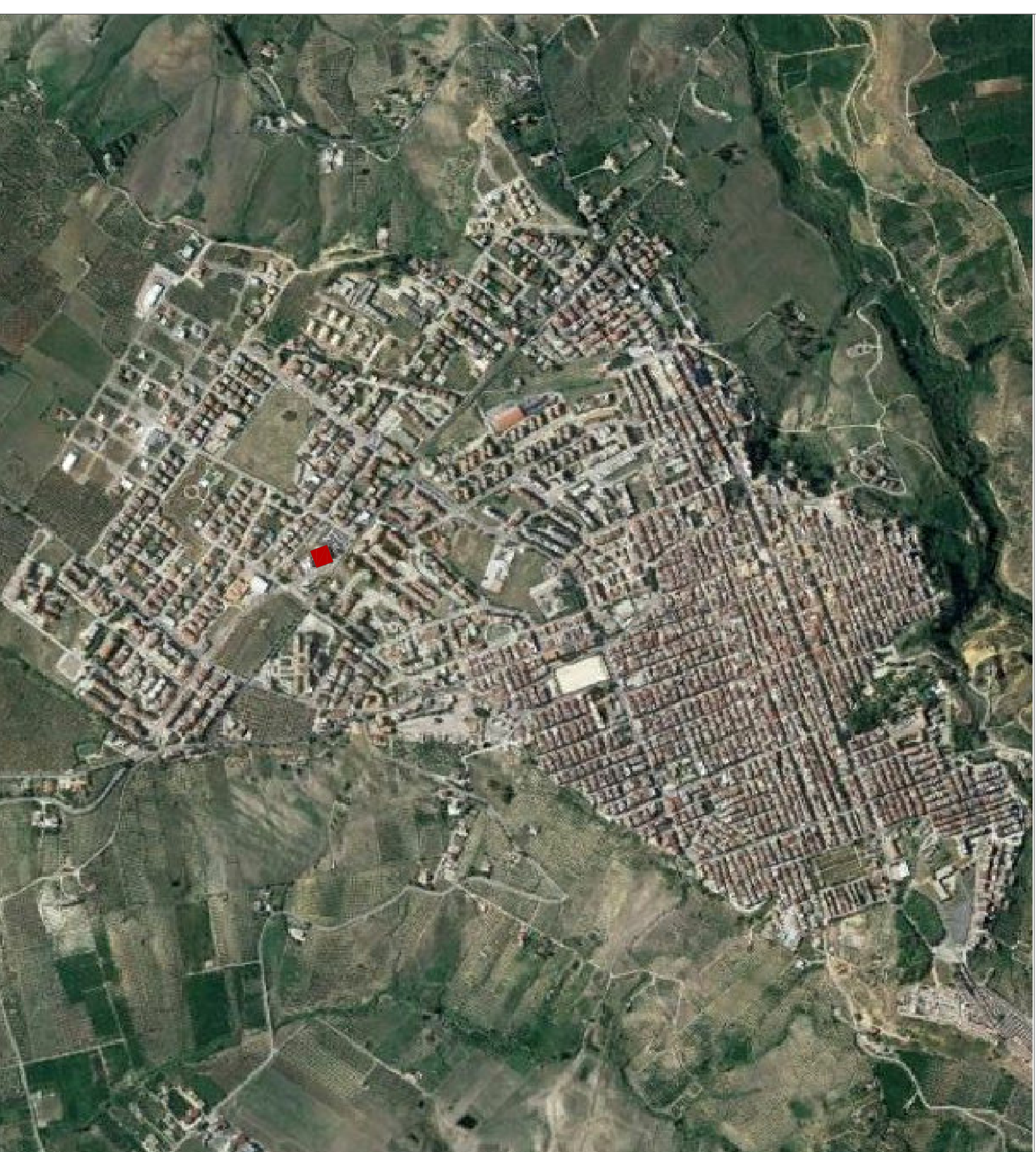
Aerofotogrammetria Google Earth Ribera