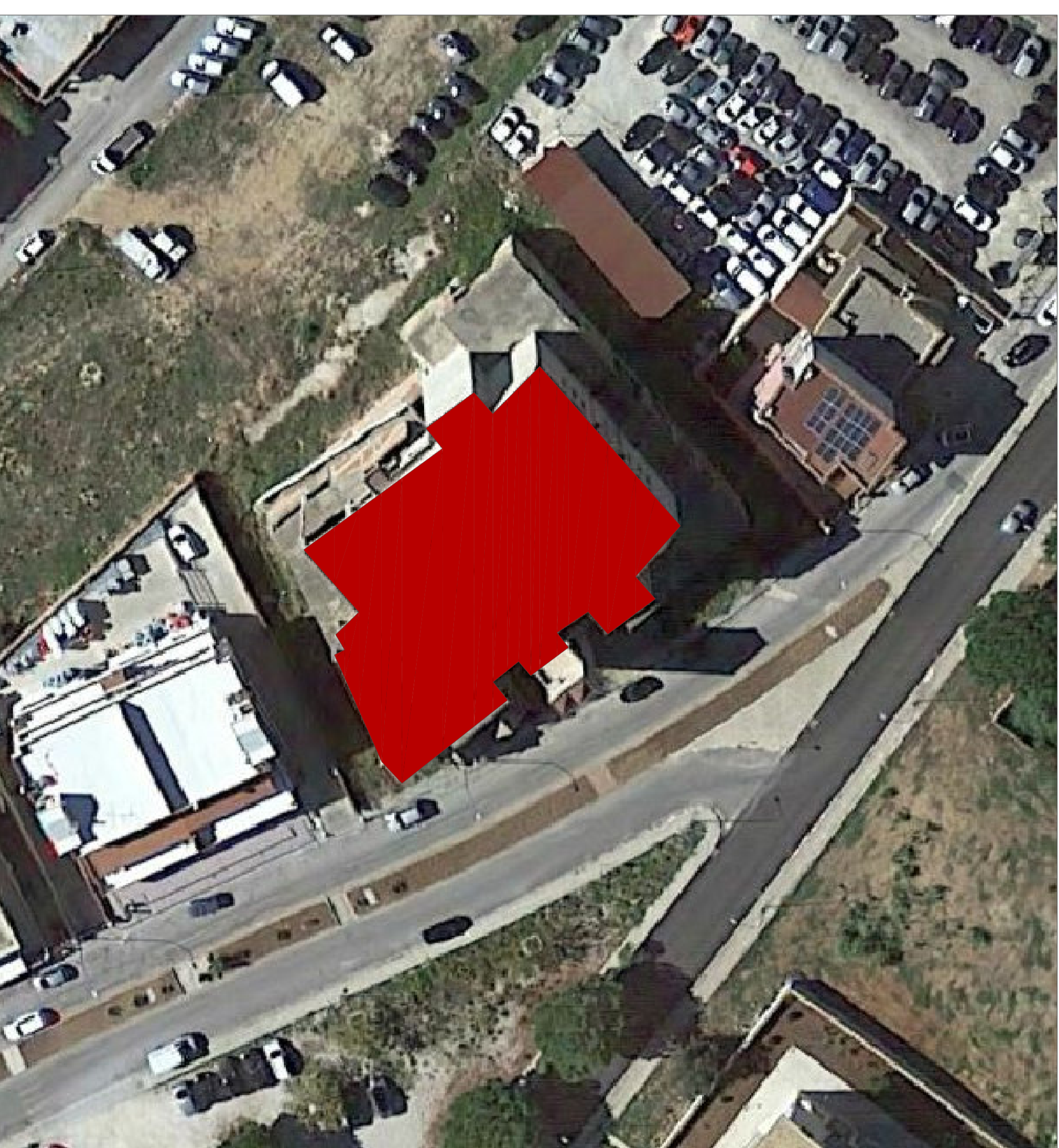
Aerofotogrammetria Google Earth con individuazione dell'area oggetto d'intervento