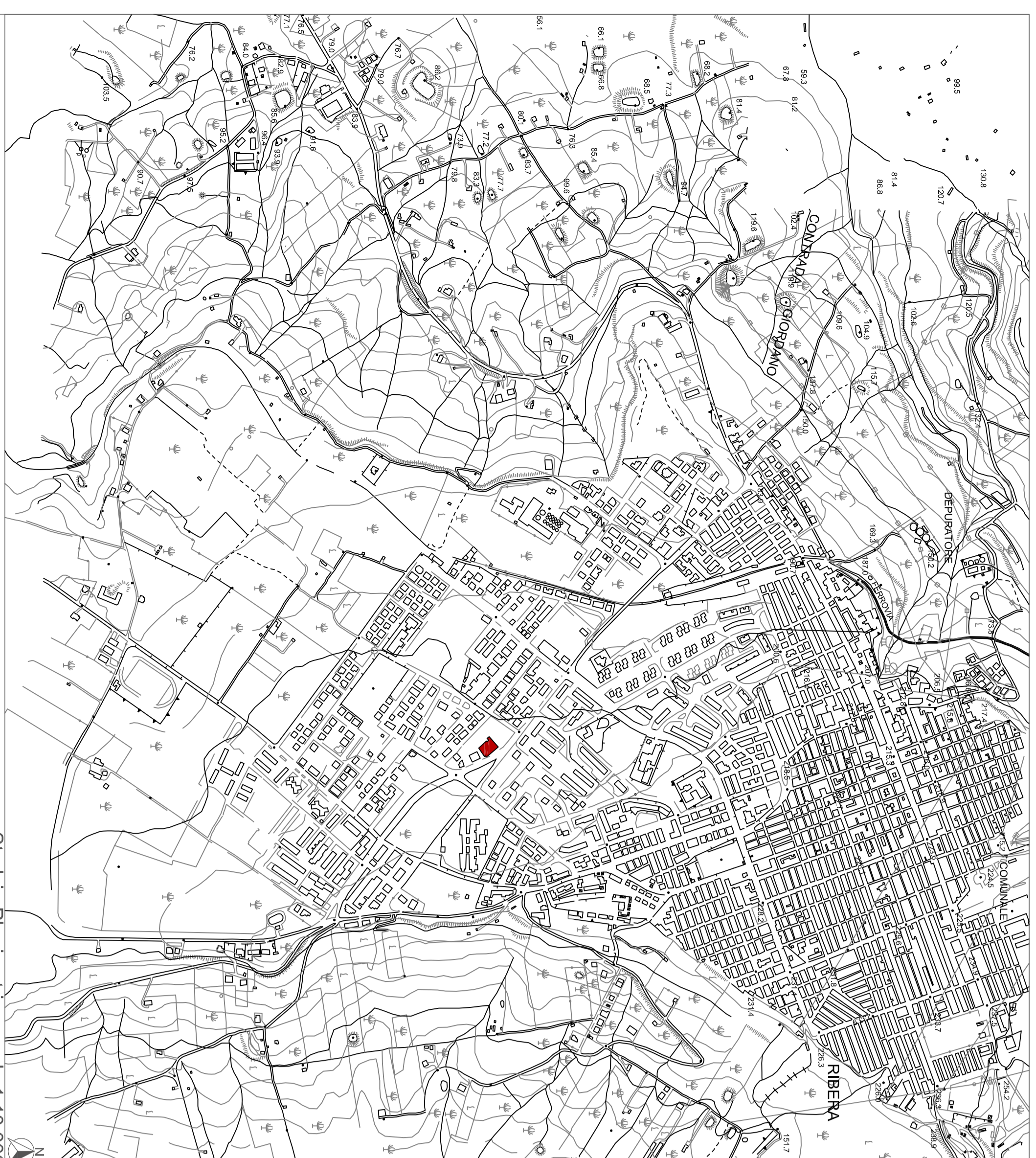
Stralcio Planimetrico scala 1:10,000